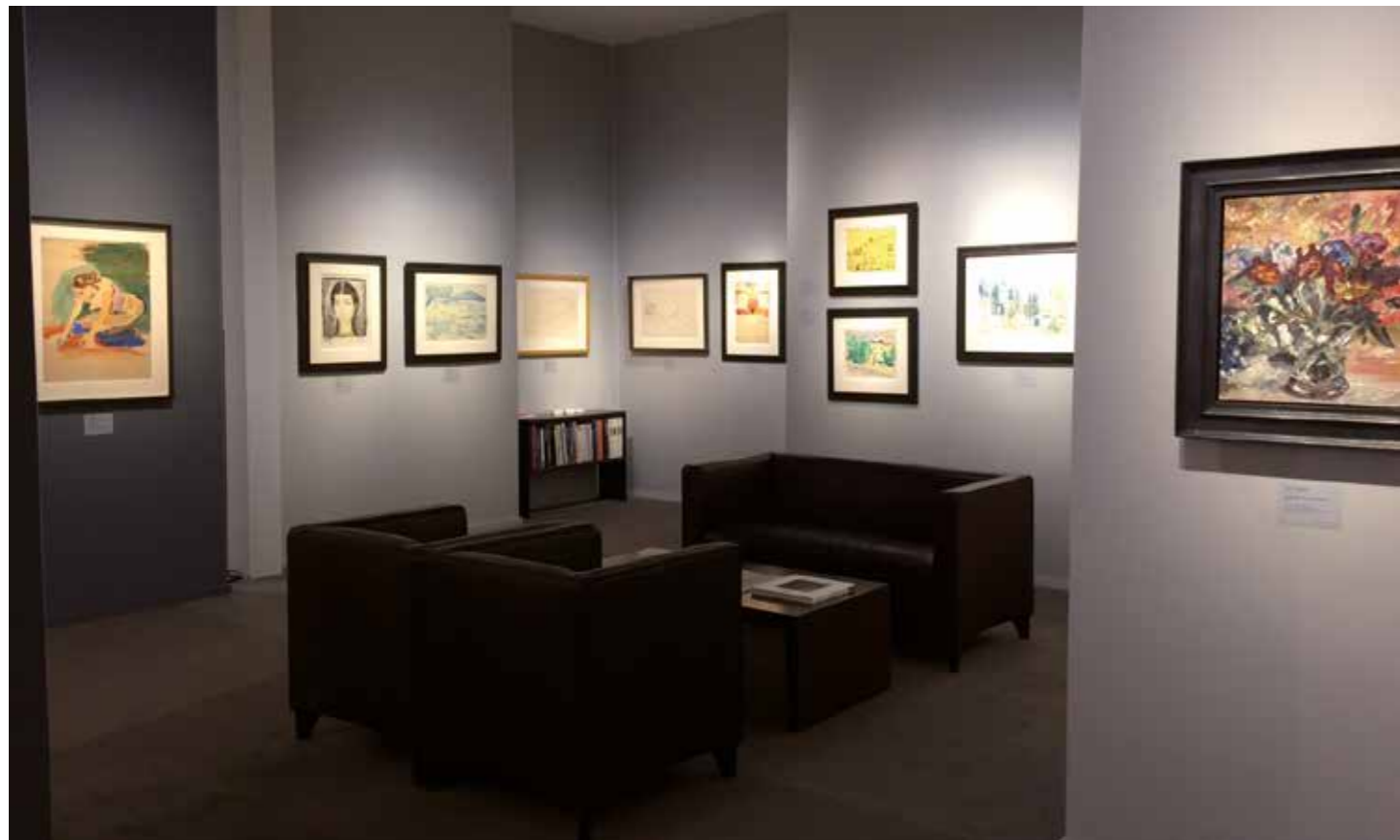
Munich Highlights 2016