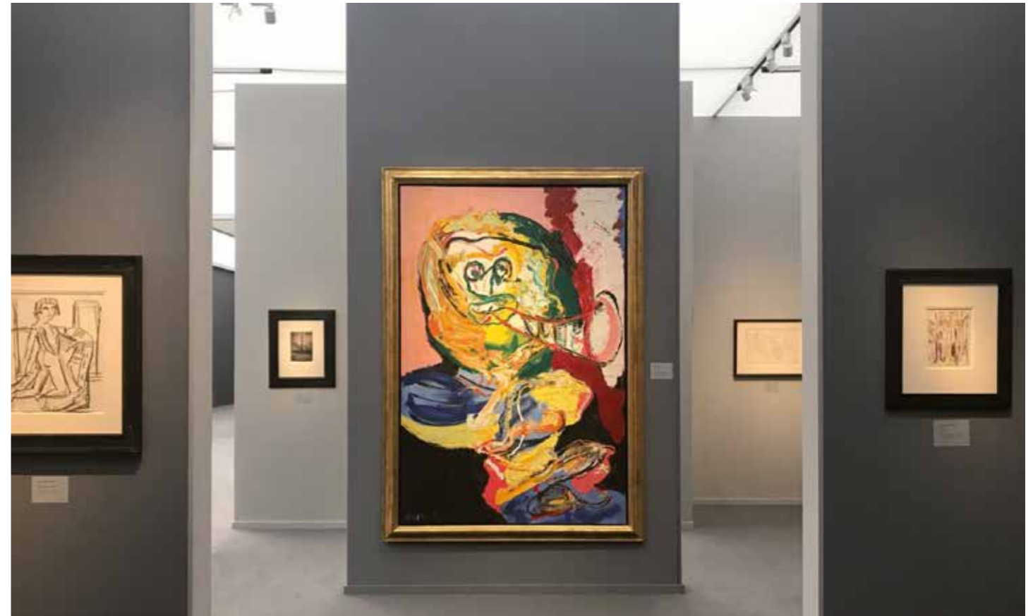
Frieze Masters London 2017