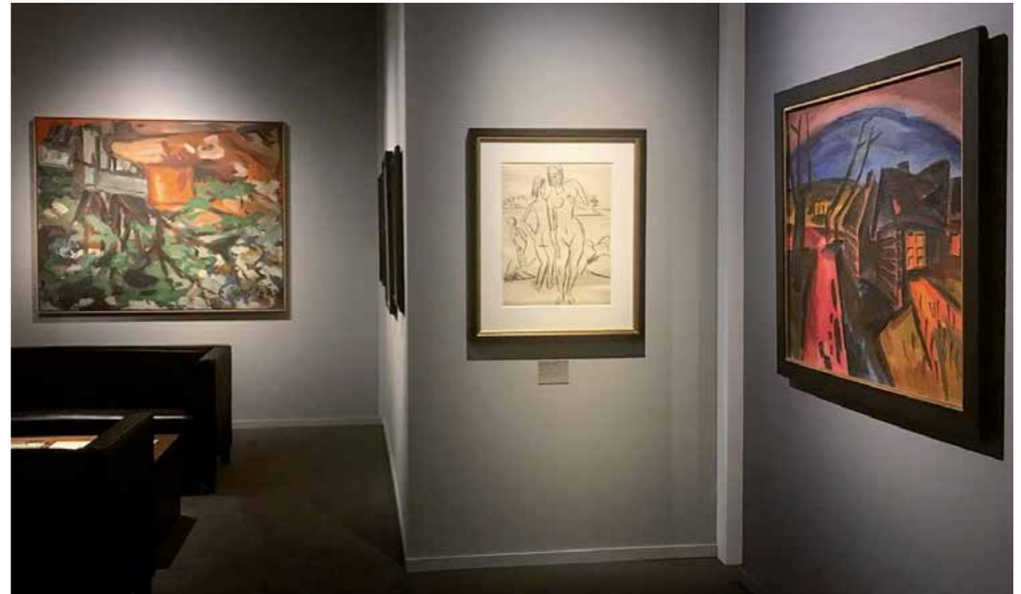
Munich Highlights 2017