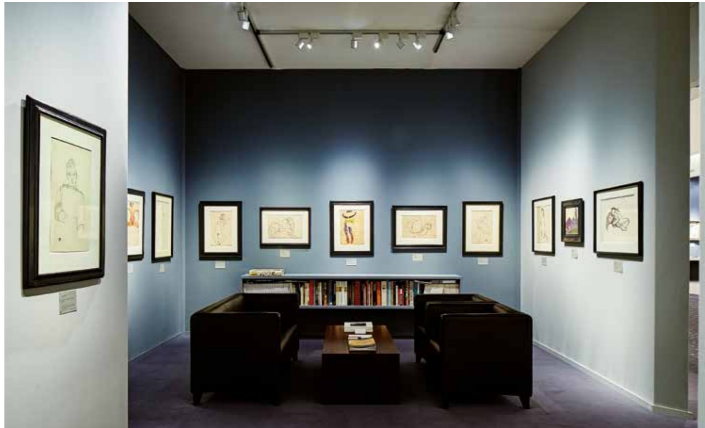
TEFAF Maastricht 2013