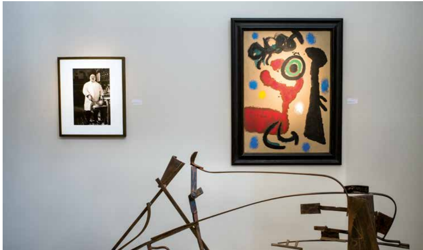
Art Salzburg - Sala Terrena 2016