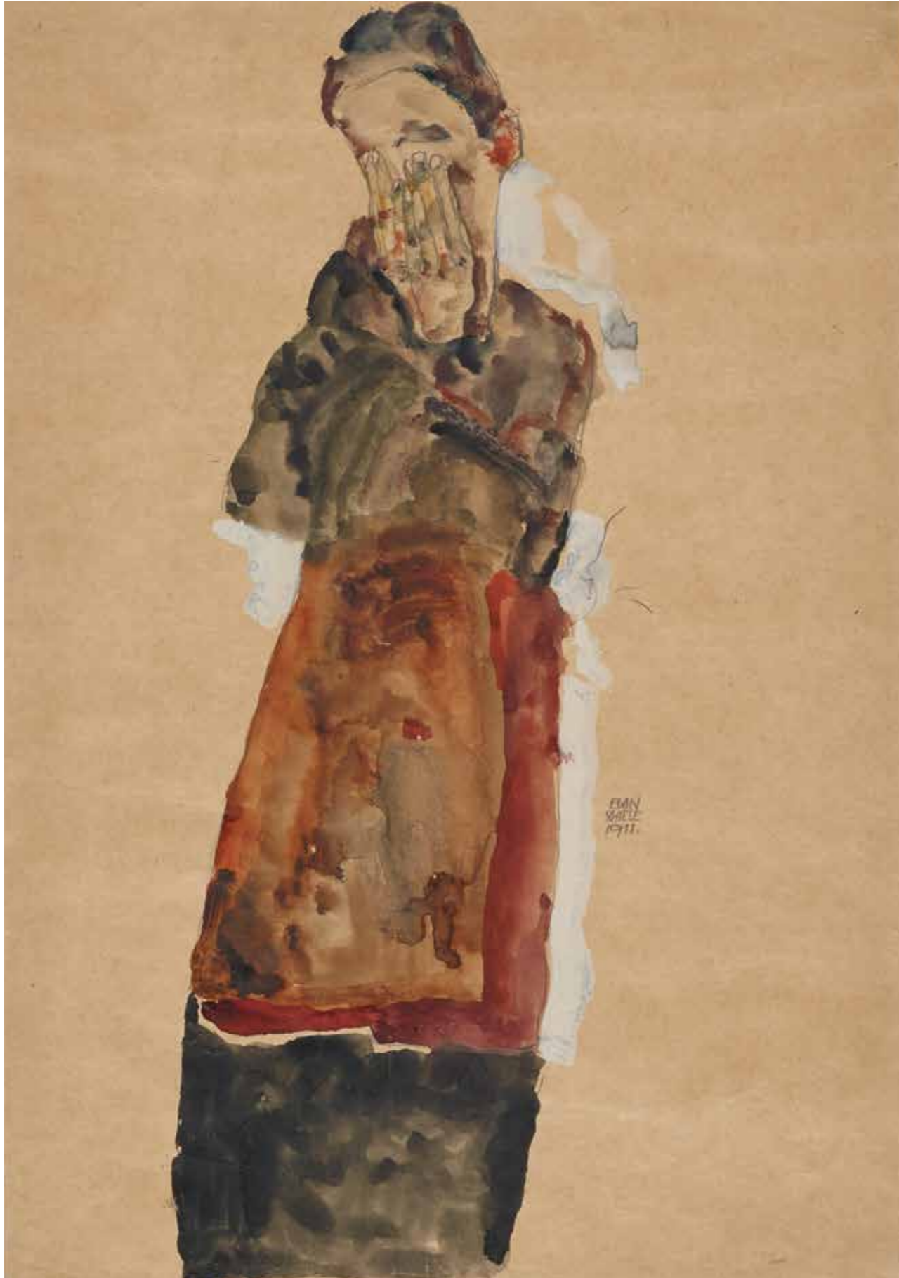
Egon Schiele, Stehendes Mädchen, das Gesicht mit beiden Händen bedeckend, 1911