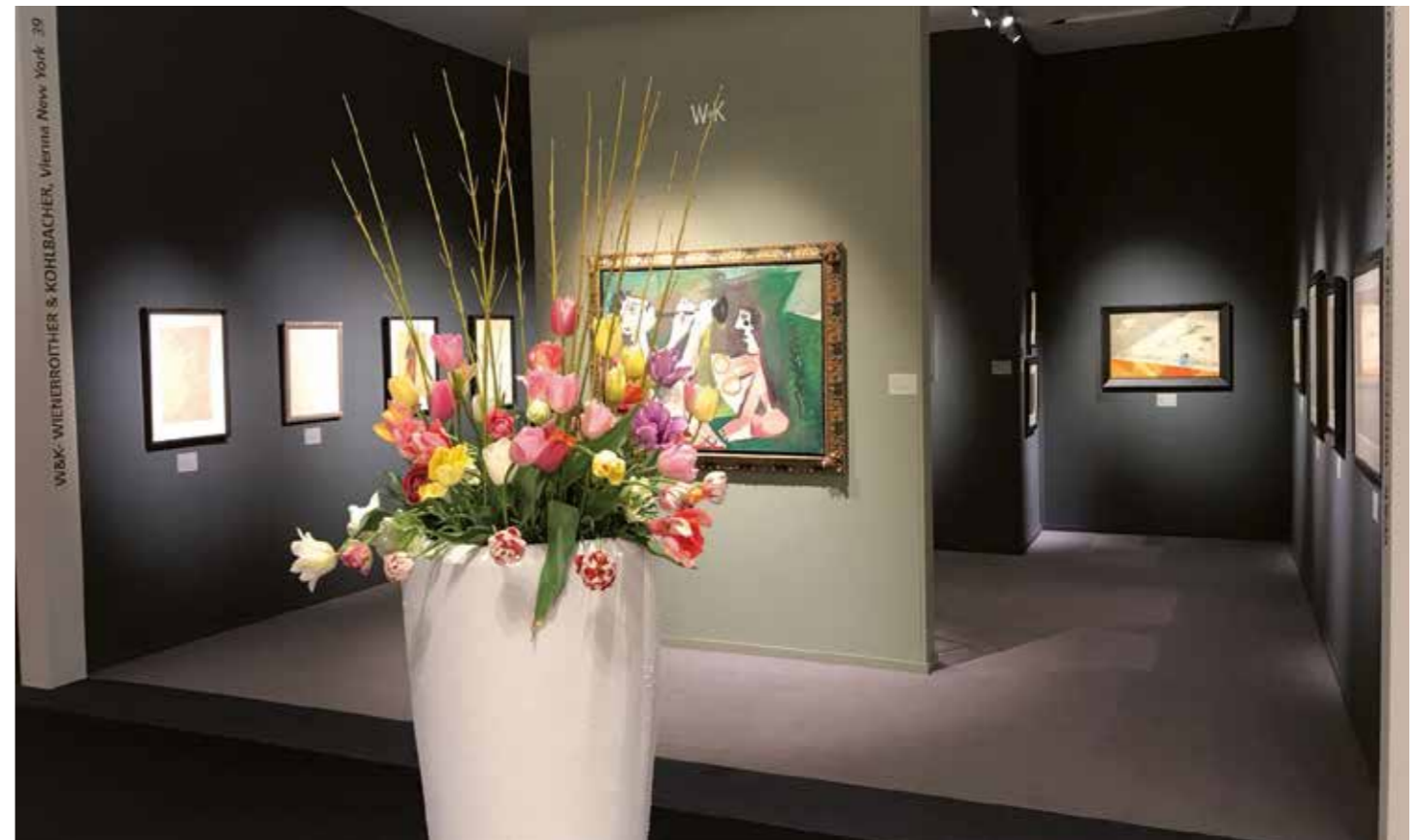
TEFAF New York Spring 2018